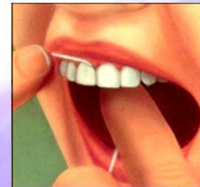
6. Зубная нить