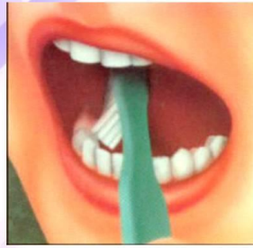
2. Внутренние поверхности зубов