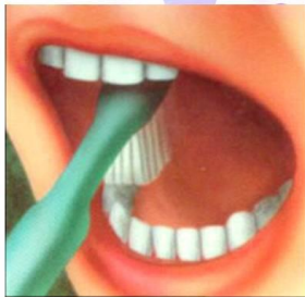
4. Жевательные поверхности зубов