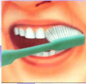
1. Наружные поверхности зубов