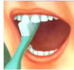
3. Внутренние поверхности передних зубов